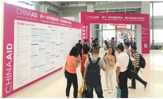
China Aid 开幕