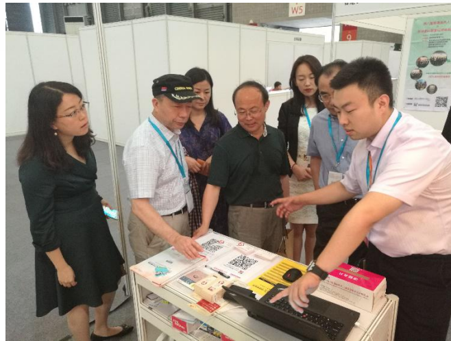
老龄办及民政部中民养老规划院领导 莅临中国养老网展台指导工作